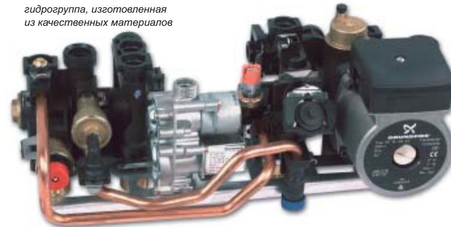
гидрогруппа, изготовленная из качественных материалов

Разработка и производство котлов «PROTHERM» сертифицированы в соответствии с международным стандартом качества ISO 9001.